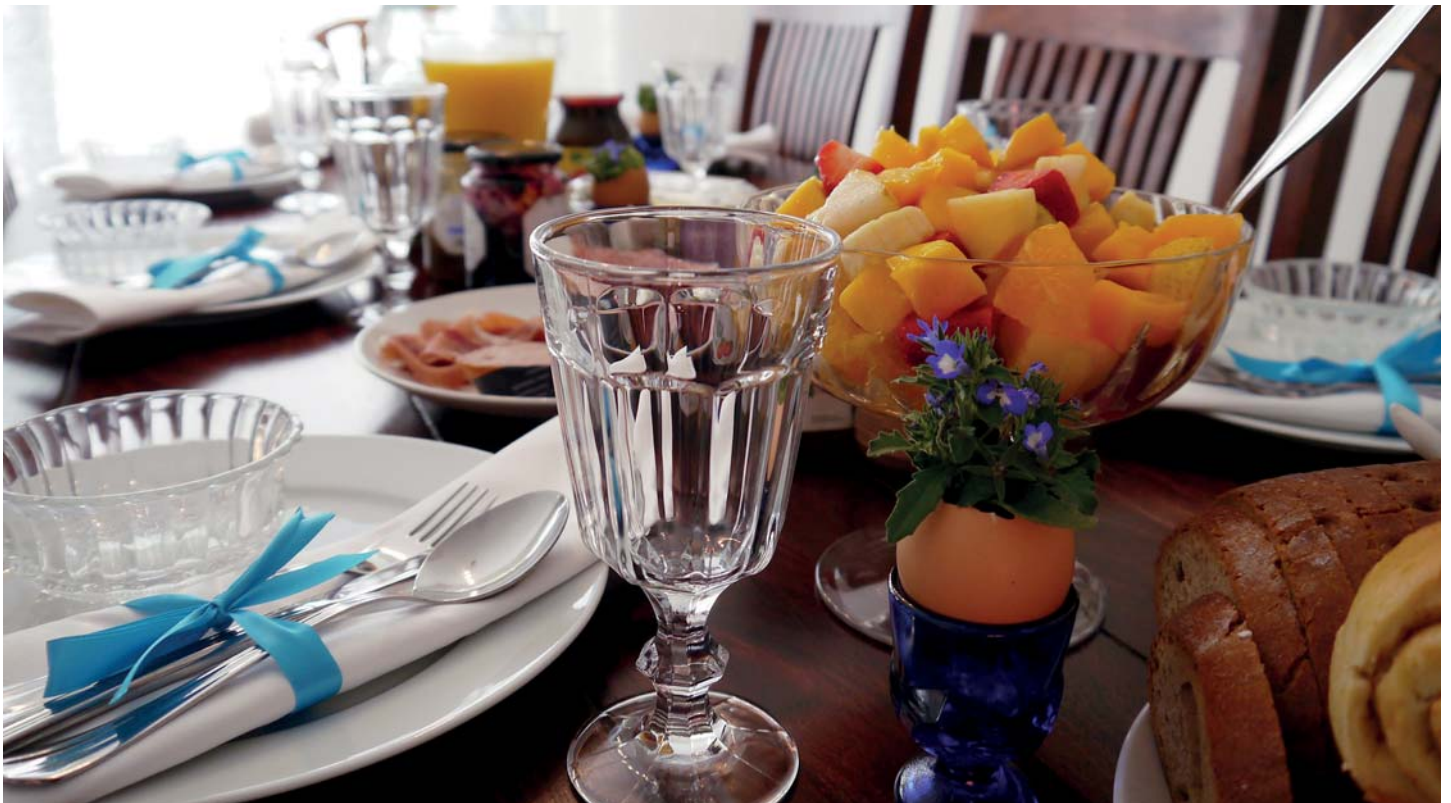
Gemeinsames Frühstück in geselliger Atmosphäre - eine Variante für einen Singeltreff

Immer mehr Menschen leben alleine. In Deutschland sind das bereits über 40 % der Bevölkerung, Tendenz: steigend. Ein-