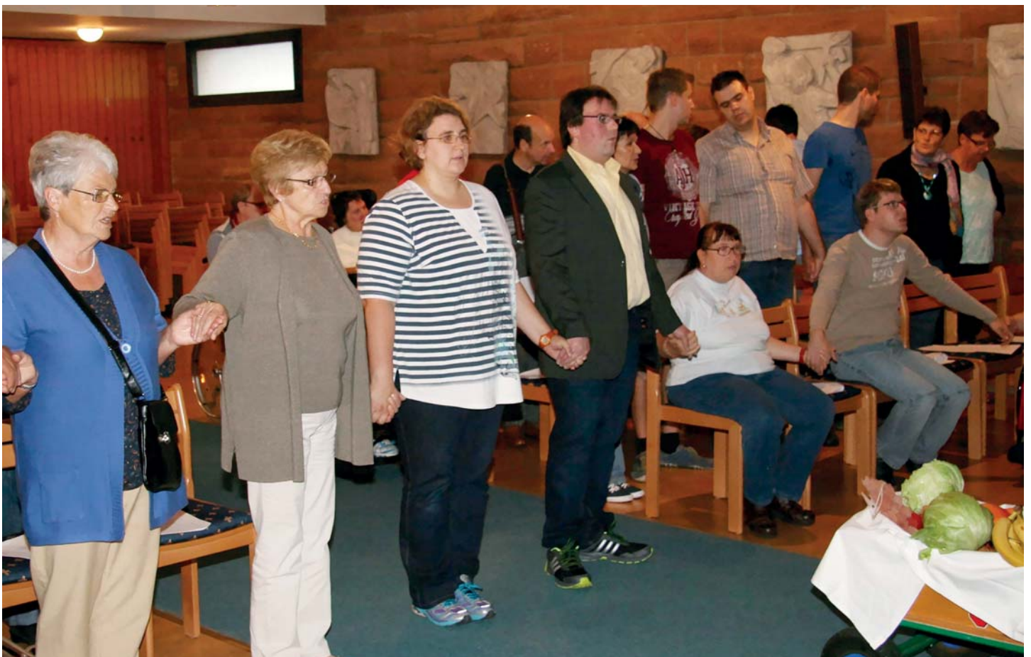
Gemeinsame Andacht in einer Einrichtung für Menschen mit Behinderung